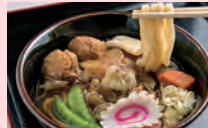
筑波山名物つくばうどん