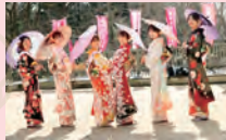
つくば観光大使のお出迎え